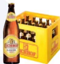
Eichhof Lager 20 x 50 cl