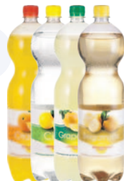
Pilatus Orange, Citro, Grapefruit & Bergamotte 6 x 150 cl