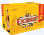
Eichhof Lager 15er Aktionspack